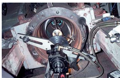
HTS 400 Vor-Ort-Einsatz