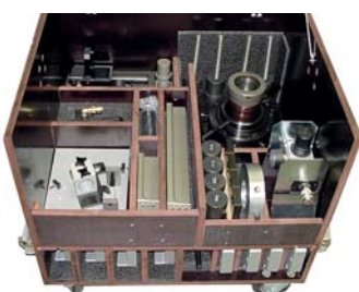
HTS Transportcontainer mit Zubehör